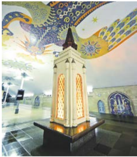
На своде станции «Кремлевская» казанского метро грозный Зилант изображен в образе доброго огнедышащего Дракоши

Покорив Казань, царь Иван Федорович внес изображение змея на герб города, и с тех пор Зилант не только охраняет сокровища царицы Сююмбрике на озере Кабан, но и бережет город от невзгод.