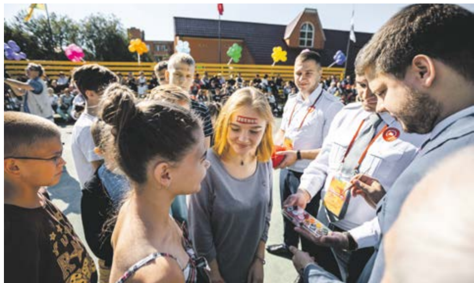
Посвящение новобранцев в ряды «35-го отряда»

7 сентября в Оздоровительном комплексе метрополитена состоялся фестиваль «35 красок». Это был праздник в честь наших детей — юных новобранцев «35-го отряда».