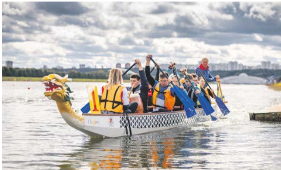
15 сентября. Гребной канал. Советы молодежи соревнуются в гребле на драконьих лодках

На гребном канале прошел чемпионат по гребле на лодках «Дракон» среди Молодежных советов Москвы. Спортсмены метрополитена представляли Совет транспортной молодежи.