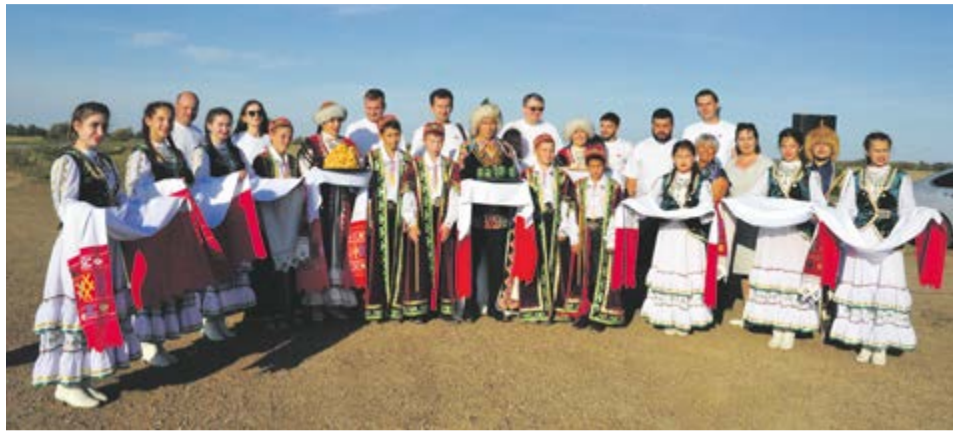
В Николо-Березовке национальными песнями и танцами нас встретил один из сельских школьных ансамблей

Памятуя об этом событии торговые люди стали каждый раз останавливаться здесь для молитвы. Так постепенно и возникло купеческое село Николо-Березовка, которое считается самым древним русским селом на территории Башкирии. Первый возведенный здесь храм был деревянным. Простоял он сто лет. Сегодня на его месте стоит церковь, сложенная из красного кирпича.