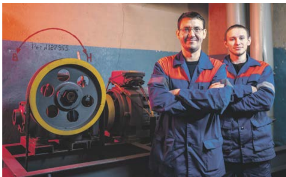
Первыми в Московском метрополитене на систему профессиональных стандартов были переведены электромеханики по лифтам

Рабочая группа по применению профессиональных стандартов, созданная из кадровиков, специалистов по обучению и развитию работников, инспекторов по промышленной безопасности, специалистов по охране труда и профсоюзных работников, в настоящий момент изучает кадровую информацию по каждому работнику метрополитена и сравнит ее с ква-