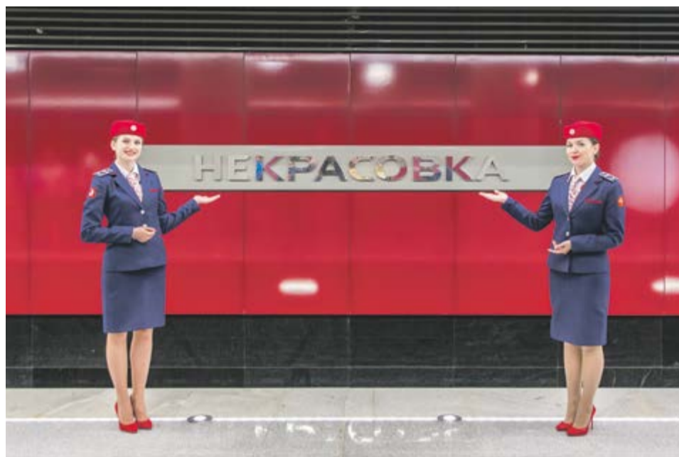
Открытие станции «Некрасовка», 3 июня 2019 года

моечных машин. Кроме того, в этот период специалисты службы приняли активное участие в разработке схемы перспективного развития метрополитена.