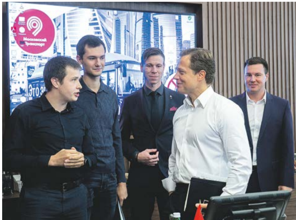
Молодые работники на встрече с заместителем мэра Максимом Ликсутовым

давно победители и призеры игры встретились с заместителем мэра Москвы в Правительстве Москвы, руководителем Департамента транспорта и развития дорожно-транспортной инфраструктуры города Максимом Ликсутовым. Они рассказали о своих идеях, таких как туристическая VR-навигация, приложения «Работа рядом с домом» и «Гуляй, Маша». Главный слоган встречи был: «Сложное сделать простым!» ММ