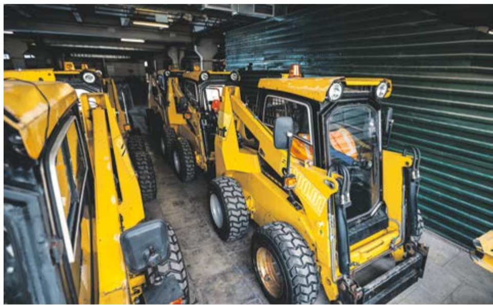
В парке Спецавтобазы 441 единица техники: 112 служебных легковых автомобилей, 329 грузовиков и автобусов

В этот визит мы познакомились и общались с некоторыми работниками подразделения. Еще раз убедились, какие разносторонние интересные люди трудятся на метрополитене.