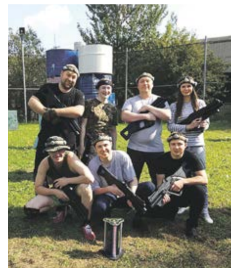
Лазертаг-команда из «Новогиреево»

Коллеги из «Новогиреево» решили поделиться своим счастьем с другими: