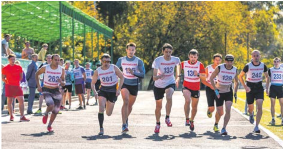
Стадион «Свиблово». Чемпионат метрополитена по легкоатлетическому кроссу

Мужчины преодолели дистанцию в 2000 м, женщины — 1000 м. Общекомандный результат среди женщин таков: 1-е место — Дирекция информационно-технологических систем и систем связи (ДИТС), 2-е место — электродепо «Варшавское», 3-е место — Управление метрополитена; среди мужчин: 1-е место — Служба безопасности, 2-е место — Управление метрополитена, 3-е место — Служба