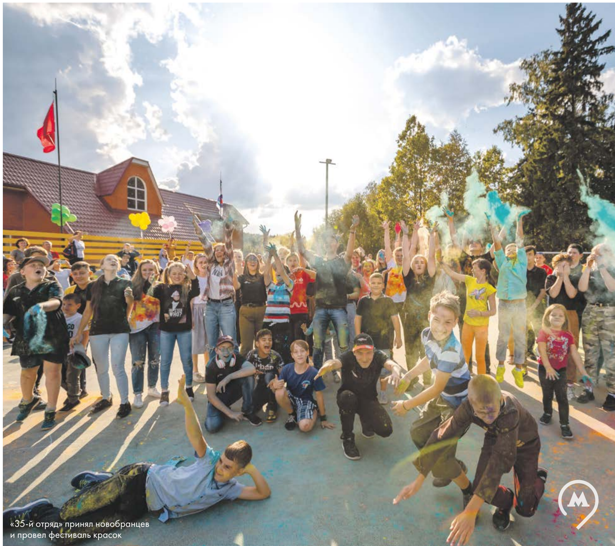
«35-й отряд» принял новобранцев и провел фестиваль красок

■ Кадровый вопрос: переходим на профстандарты стр. 5