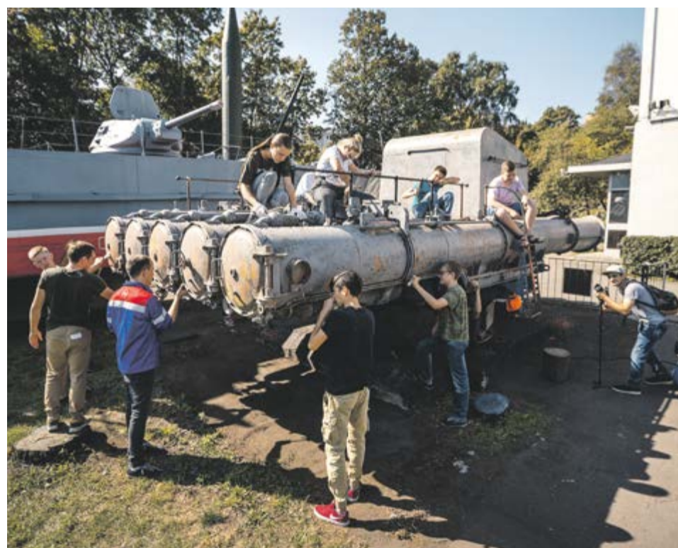
Наши люди в Центральном музее Вооруженных Сил РФ. Реставрация торпедного аппарата

Совет молодежи благодарит участников нынешней акции «Восстановим историю вместе» и планирует новые. Будем следить за их инициативами. MM