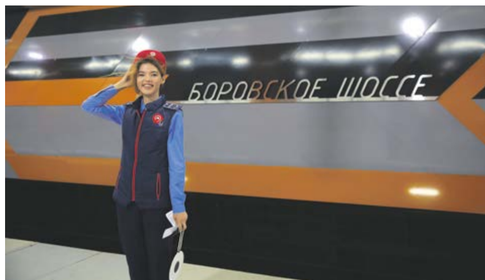
Дежурный по станции «Боровское шоссе»

В первые послевоенные годы Служба движения основные усилия направляла на организацию перевозок пассажиров в условиях резко растущих пассажиропотоков (количество перевозимых пассажиров в 1945 году превысило довоенный уровень более чем в полтора раза и продолжало резко расти), на улучшение системы информирования пассажиров, а также на механизацию трудоемких уборочных процессов. В 1948 году началось массовое внедрение на станциях поло-