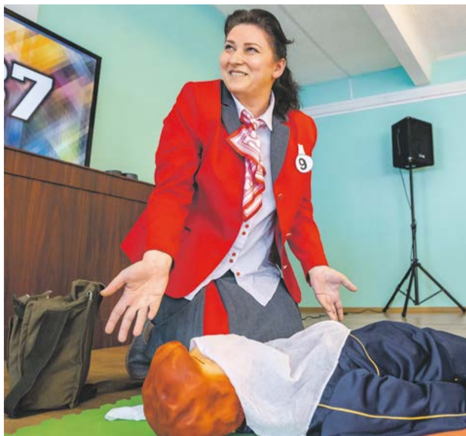
Непростые задания конкурсантам в радость

По результатам отборочного этапа определились 12 финалистов — по три участника в каждой команде, набравшие максимальное количество баллов. Они прошли во второй этап.