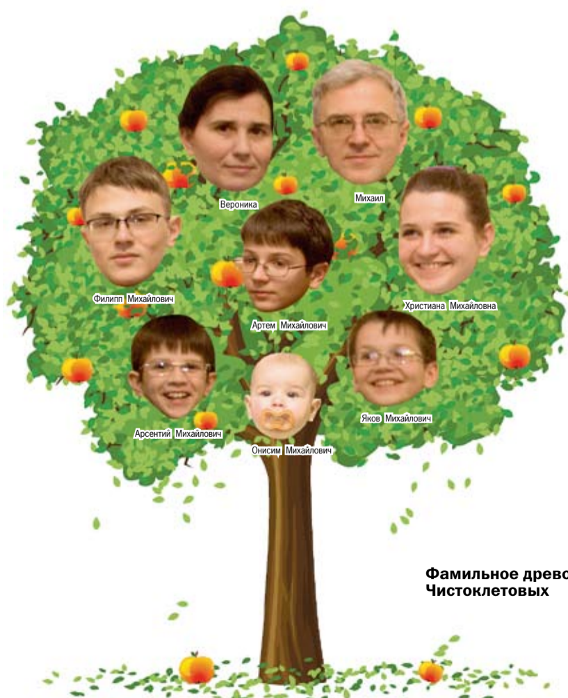
Фамильное древо Чистоклетовых