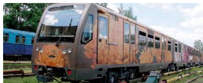
Поезд «Акварель» был сделан на базе вагонов «Русич»