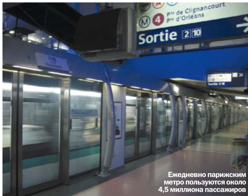
Ежедневно парижским метро пользуются около 4,5 миллиона пассажиров

2010 год стал Годом России во Франции и Годом Франции в России. В честь этого в газете «Мое метро» мы хотим рассказать об одном из самых крупных и известных метрополитенов мира – парижском.