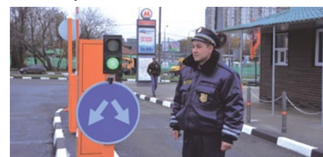
Перехватывающая парковка метрополитена у станции «Аннино»

Силами подразделений метрополитена в новом вестибюле станции «Аннино» были установлены кассовые окна, турникеты и проведены другие работы, необходимые для ввода в эксплуатацию этого объекта. Работы проводились ускоренным темпом, и уже в ближайшие дни пассажиры «Аннино» смогут спуститься на станцию через любой из двух вестибюлей.